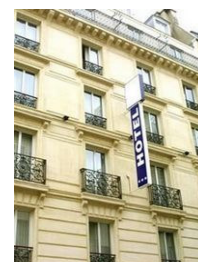
Hôtel Frochot à Paris