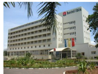
Hôtel Ibis à Lomé