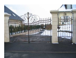
Portails pour particuliers