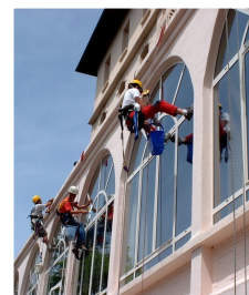
Nettoyage en hauteur